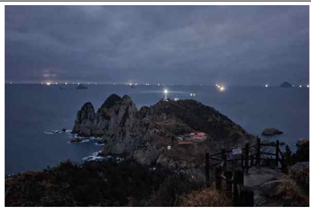
등대섬 야간 점등 모습

4월 ‘이달의 무인도서’로는 경상남도 통영시 한산면 매죽리에 있는 ‘등대섬’을 선정하였다.