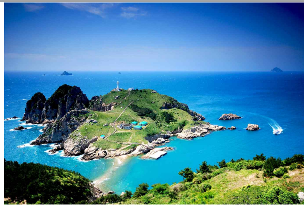
등대섬 전경