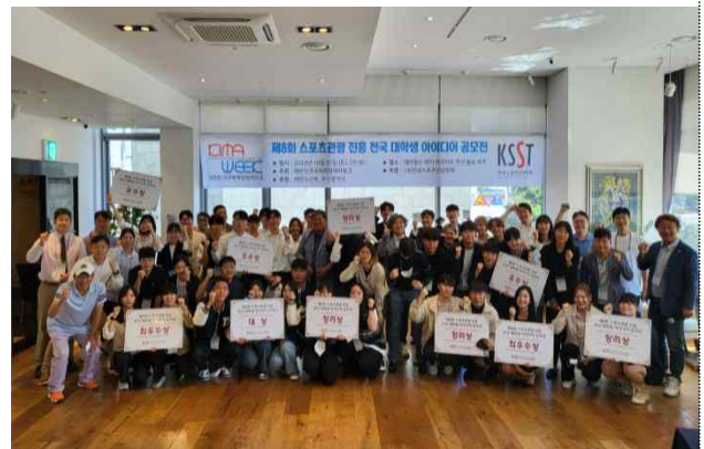
대학생 아이디어 공모전