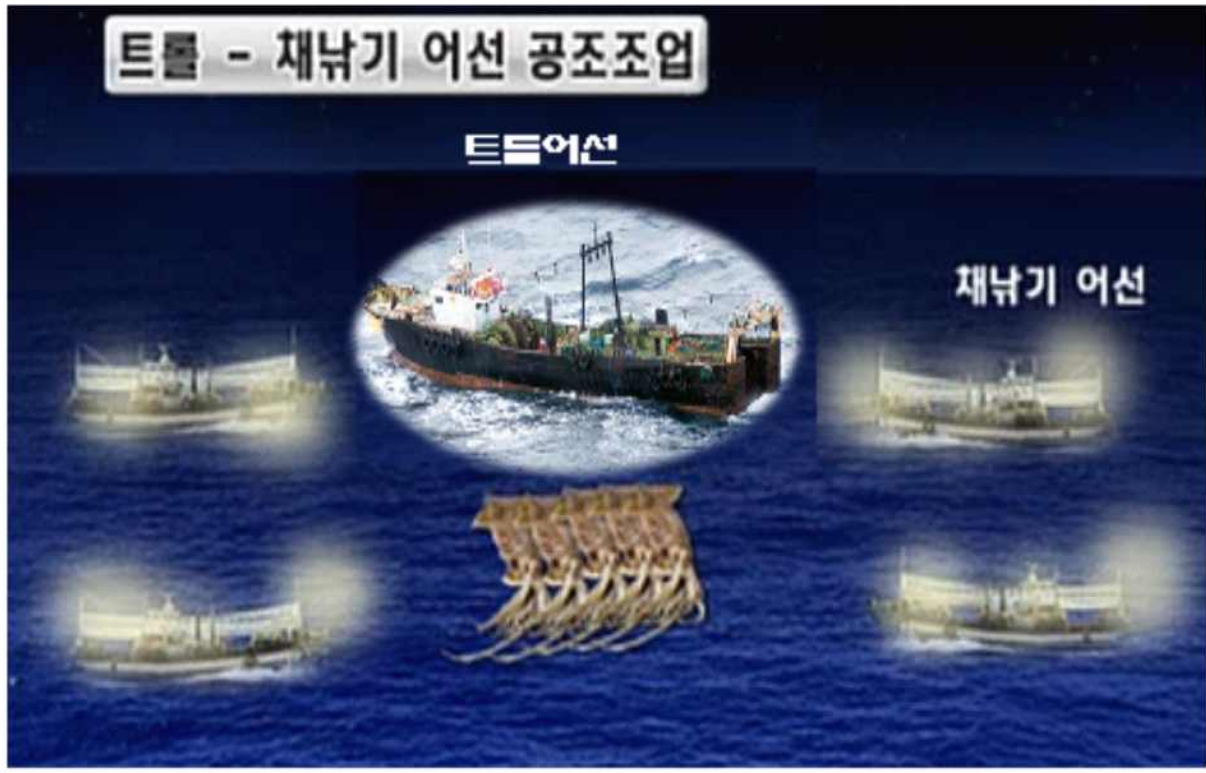
트롤-채낚기 어선 공조조업 방식 예시