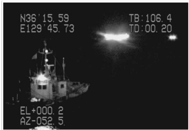
CCTV에 촬영된 불법 공조조업 모습