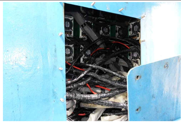
불법 광력설비 추가 설치