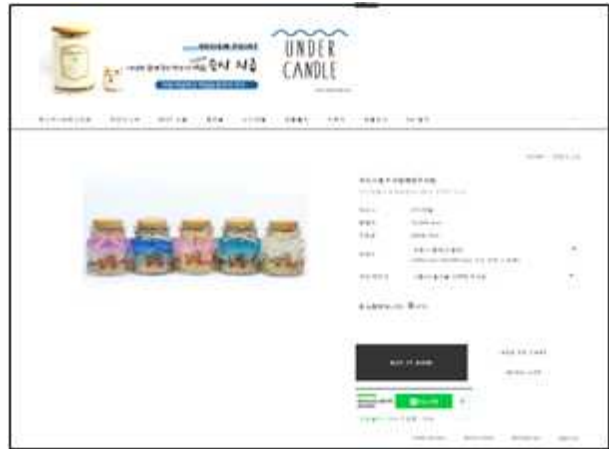
<UNDER Candle 온라인 판매>