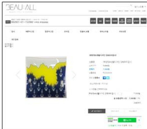
<BEAUALL 접시 온라인 판매>