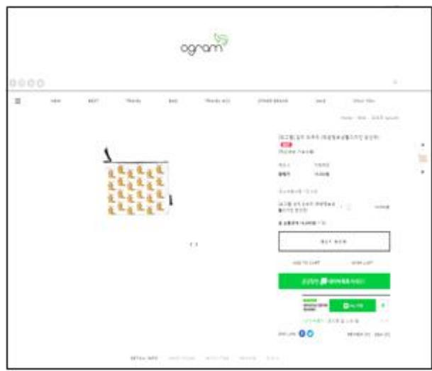
<Ogram 파우치 온라인 판매>