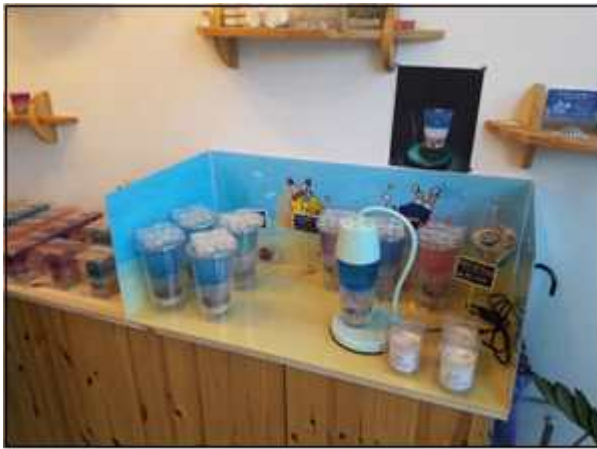
<UNDER Candle 감천 문화마을 매장 판매>