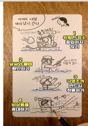
유튜브 솟폼 부문 대상 수상작