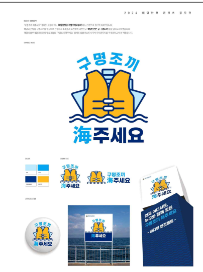
심볼마크 부문 대상 수상작