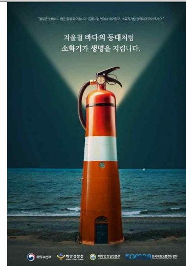
포스터 부문 대상 수상작