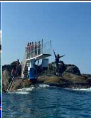
해상 물놀이시설(플로팅 브리지 및 다이빙시설)