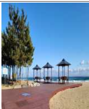
가족 친화적인 시설물 조성