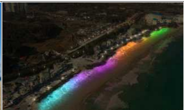
자연 경관조명 설치