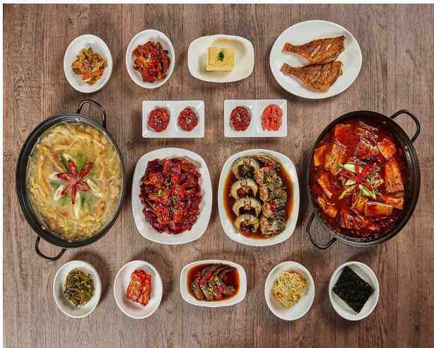
갈치와 돌개장을 이용한 엄마밥상