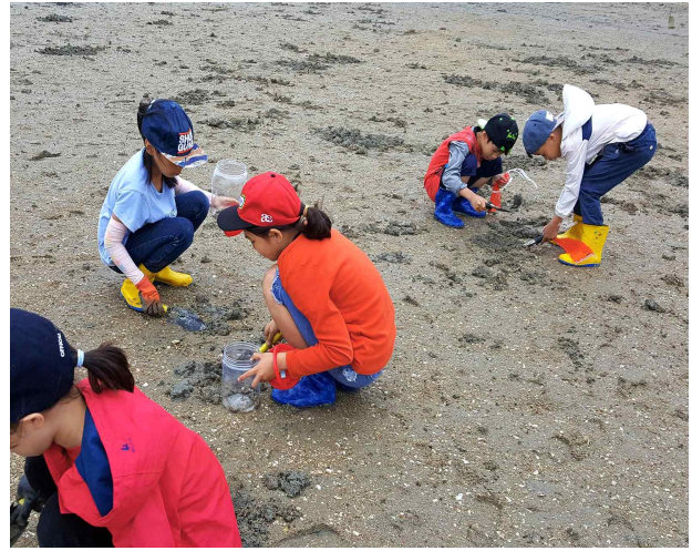
바지락 캐기 체험