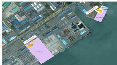
광양항(전체 287,883㎡/ 임대가능 164,486㎡)