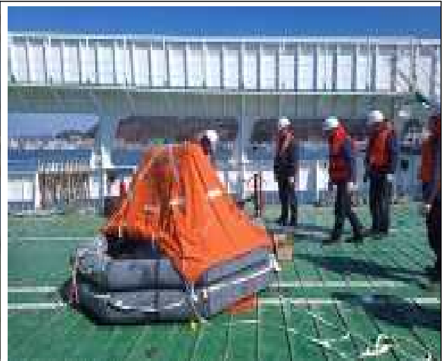
전기차 화재대응 훈련