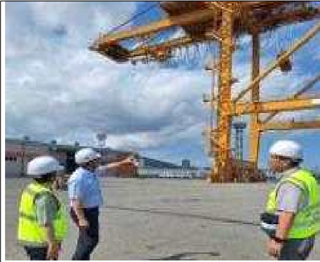
항만 크레인 점검