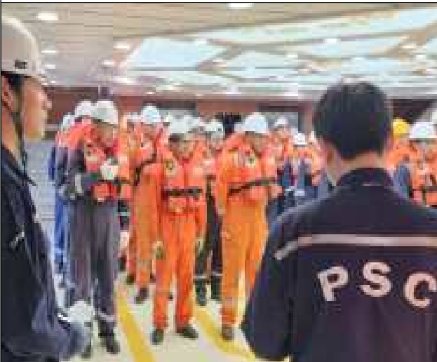
여객선 안전 교육