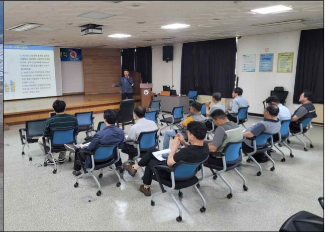
건설현장 위험요인 개선방안 컨설팅