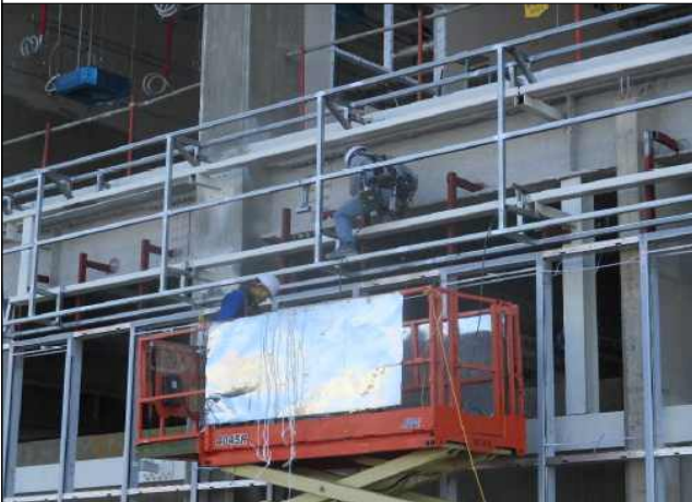
고소작업시 안전대 미체결(개선전)