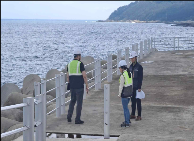
중대재해 예방 안전점검 사진