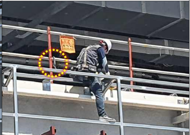
고소작업시 안전대 체결완료(개선후)