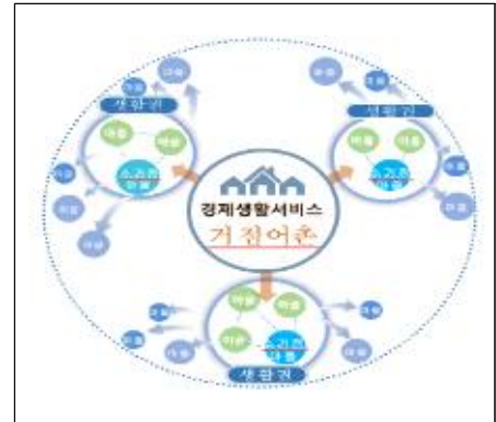
< 생활·경제 Hub&Spoke >

※ 수산물 가공·유통 단지 등 대규모 자본 필요 시설은 민간 투자 유치, 어항 도입시설 확대, 절차 간소화 등 규제혁신 및 ' 어촌어항 활력펀드 (가칭)' 도입 등 민간 투자 여건 개선