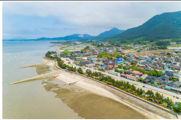
하전마을 갯벌 및 자전거도로 전경