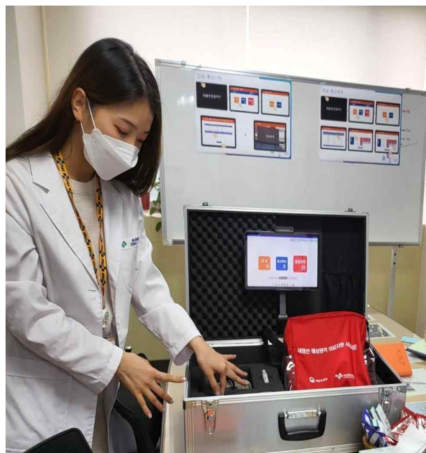
의료지원 키트 구성